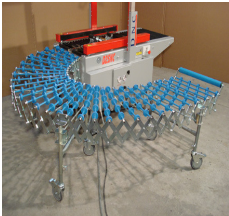
Fleksibel rullebane på hjul