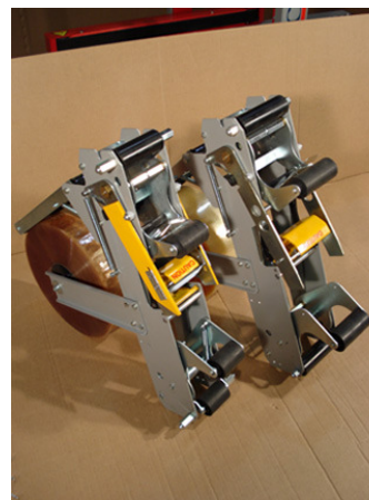
Tapehoveder 50 mm